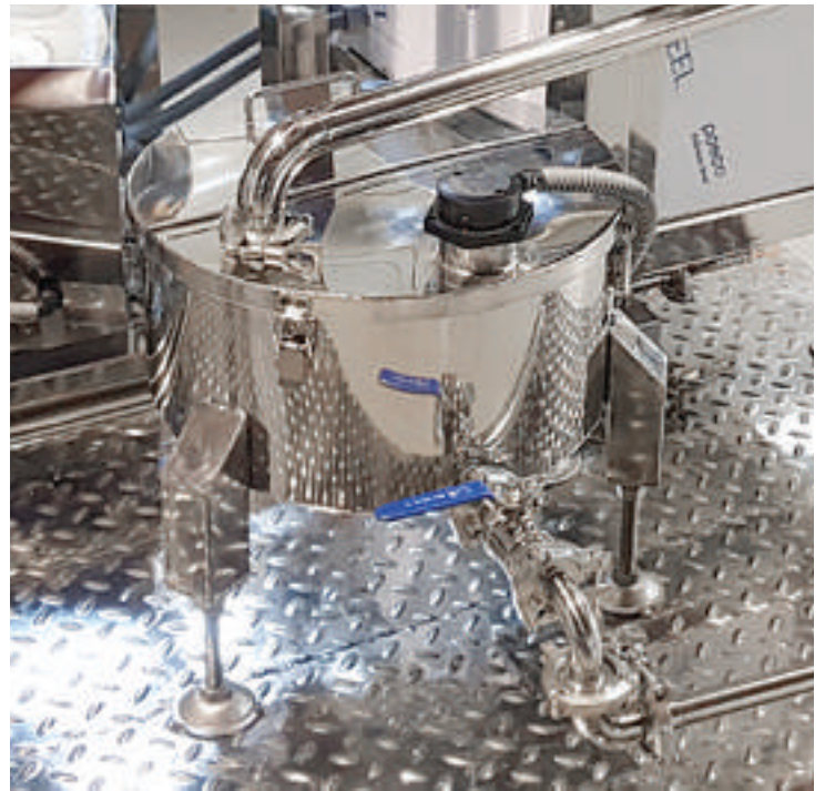
착즙된 액상을 저장하고, 배출하는 출구가 있는 탱크