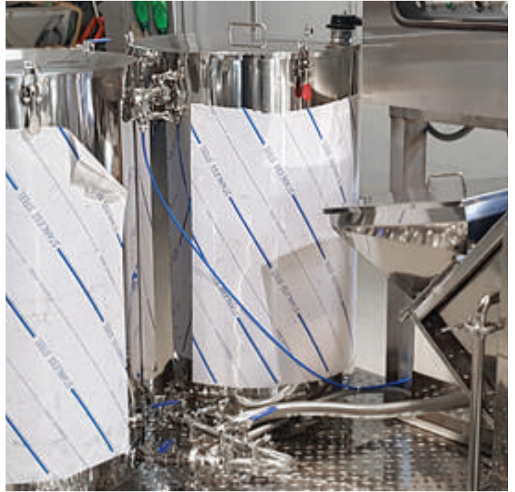
과실 및 과채류 세척후 살균용으로 물을 저장해두는 탱크