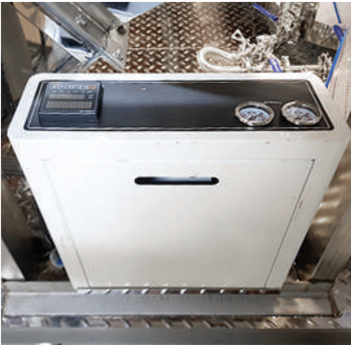
원물을 세척하기위해 살균수를 만드는 제조장치