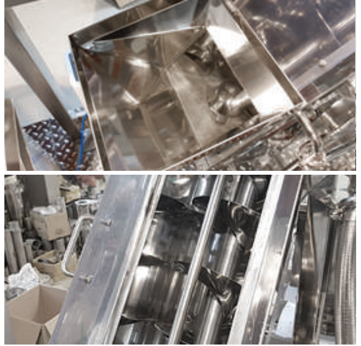
원물투입구, 물이나 원물 튼 방지를 위한 덮개와 내부 스크루