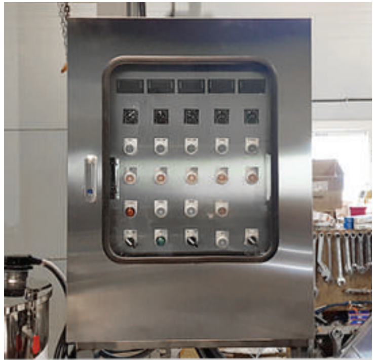
각 부분의 제어와 조절을위해 조작하는 컨트롤박스