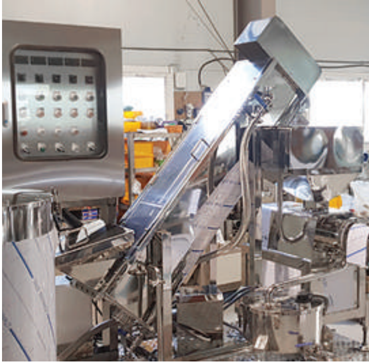
스크루타입으로 과채류를 세척하여 착즙기로 투입하는 세척기